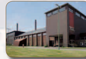
RUHRTRIENNALE 2013 SALZLAGER ESSEN ARENDAHLS WIESE 45141 ESSEN

Die Geschichte der Jahrhunderthalle Bochum beginnt im Jahr 1903. Im Herzen des Stahlwerks „Bochumer Verein für Bergbau und Gußstahlfabrikation“ wurde eine monumentale Stahlkonstruktion errichtet. Diese Gaskraftzentrale versorgte über sechzig Jahre das Stahlwerk und die Siedlung Stahlhausen mit Energie. Ab Februar 2002 wurde die Jahrhunderthalle Bochum zu einem spektakulären Festspielhaus umgebaut. Der einzigartige Innenraum mit seiner morbiden Ausstrahlung ist dabei nahezu unverändert belassen worden.