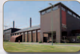
RUHRTRIENNALE 2013 SALZLAGER ESSEN

Freitag, 27. September 2013 um 20.00 Uhr