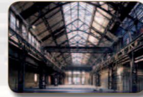
RUHRTRIENNALE 2013 JAHRHUNDERTHALLE BOCHUM AN DER JAHRHUNDERTHALLE 1 44793 BOCHUM

Die Geschichte der Jahrhunderthalle Bochum beginnt im Jahr 1903. Im Herzen des Stahlwerks „Bochumer Verein für Bergbau und Gußstahlfabrikation“ wurde eine monumentale Stahlkonstruktion errichtet. Diese Gaskraftzentrale versorgte über sechzig Jahre das Stahlwerk und die Siedlung Stahlhausen mit Energie. Ab Februar 2002 wurde die Jahrhunderthalle Bochum zu einem spektakulären Festspielhaus umgebaut. Der einzigartige Innenraum mit seiner morbiden Ausstrahlung ist dabei nahezu unverändert belassen worden.