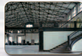
RUHRTRIENNALE 2013 MASCHINENHALLE ZWECKEL FRENTROPER STRASSE 74 45966 GLADBECK

Das 1958 erbaute Salzlager gehört zur „weißen Seite“ der Kokerei Zollverein. Die Salzfabrik ist Teil eines dreigliedrigen Gebäudekomplexes, bestehend aus einer Ammoniakfabrik, dem Salzlager und der Verladung. In der Salzfabrik wurde bis in die 1980er Jahre Dünger hergestellt. Seit der Stilllegung der Kokerei 1993 tragen Projekte zeitgenössischer Kunst sowie Theaterinszenierungen kontinuierlich zur Neuinterpretation der Anlage bei.