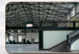
RUHRTRIENNALE 2013 MASCHINENHALLE ZWECKEL FRENTROPER STRASSE 74 45966 GLADBECK

Das 1958 erbaute Salzlager gehört zur „weißen Seite“ der Kokerei Zollverein. Die Salzfabrik ist Teil eines dreigliedrigen Gebäudekomplexes, bestehend aus einer Ammoniakfabrik, dem Salzlager und der Verladung. In der Salzfabrik wurde bis in die 1980er Jahre Dünger hergestellt. Seit der Stilllegung der Kokerei 1993 tragen Projekte zeitgenössischer Kunst sowie Theaterinszenierungen kontinuierlich zur Neuinterpretation der Anlage bei.