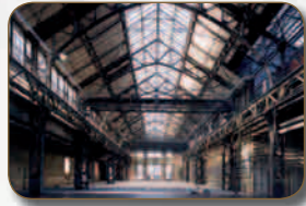
RUHRTRIENNALE 2013 JAHRHUNDERTHALLE BOCHUM