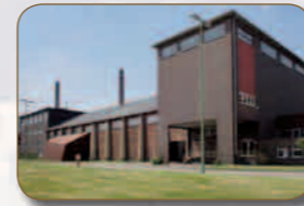
RUHRTRIENNALE 2013 SALZLAGER ESSEN ARENDAHLS WIESE 45141 ESSEN

Die Geschichte der Jahrhunderthalle Bochum beginnt im Jahr 1903. Im Herzen des Stahlwerks „Bochumer Verein für Bergbau und Gußstahlfabrikation“ wurde eine monumentale Stahlkonstruktion errichtet. Diese Gaskraftzentrale versorgte über sechzig Jahre das Stahlwerk und die Siedlung Stahlhausen mit Energie. Ab Februar 2002 wurde die Jahrhunderthalle Bochum zu einem spektakulären Festspielhaus umgebaut. Der einzigartige Innenraum mit seiner morbiden Ausstrahlung ist dabei nahezu unverändert belassen worden.