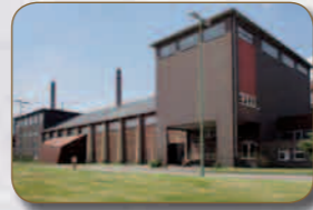
RUHRTRIENNALE 2013 SALZLAGER ESSEN

Freitag, 27. September 2013 um 20.00 Uhr